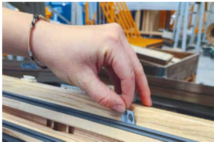
/ Zum Schluss positioniert die Mitarbeiterin den NFC-Chip an eine vordefinierte Stelle, immer oberhalb des Griffs.

Handy oder Tablet inklusive Zeiten und benötigtem Material. Er hat so jederzeit Zugriff auf Auftragsunterlagen wie Zeichnungen, Produktinformationen etc. Falls er auf der Baustelle bemerkt, dass etwas fehlt oder beschädigt ist, schickt er direkt über die App mit dem Smartphone eine Meldung an den Innendienst, der sich dann sofort um eine Lösung kümmern kann.