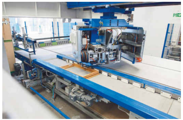
In der Endmontagehalle der Holz-Alu-Fenster kommt für das Befestigen der Klipshalterungen der Montageautomat der Serie KMA333 von Lemuth zum Einsatz.