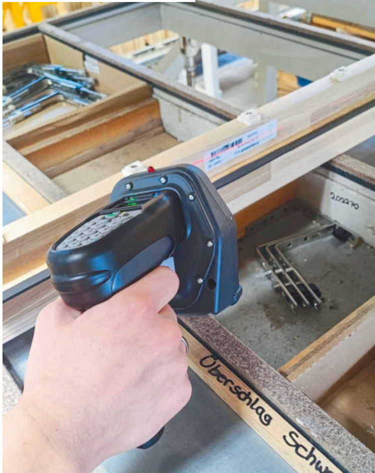
/ Damit das Fenster eindeutig identifizierbar ist, werden Fenster und NFC-Chip „verheiratet“. Zuerst scannt die Mitarbeiterin den Barcode des Fensters ...