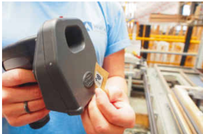
/ ... dann wird der NFC-Chip auf den Scanner gelegt und so mit den spezifischen Auftragsdaten des Fensters verknüpft.