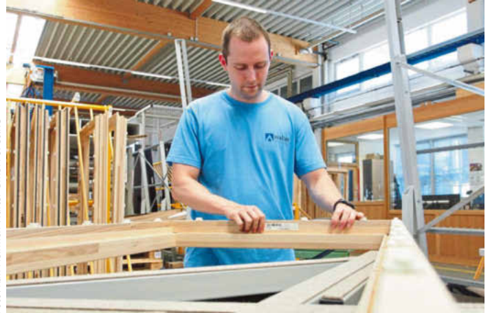
Danach setzt der Mitarbeiter sämtliche Dichtungen ein, bevor die Fenster gechipt und verglast werden.