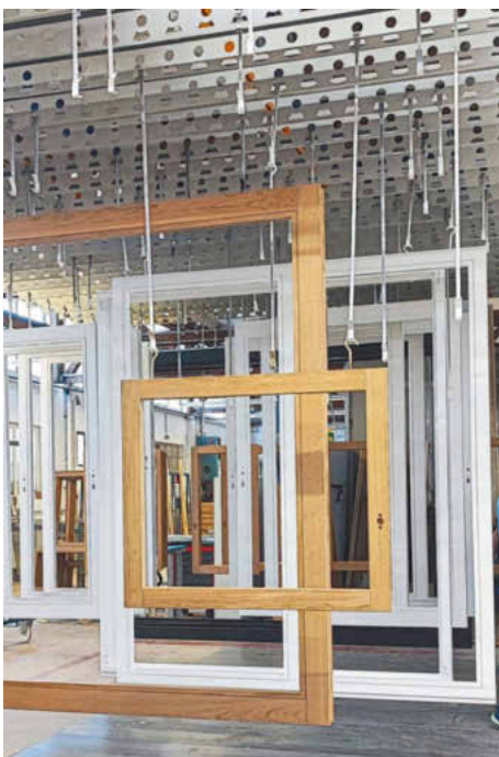
/ Bei den Holzfenstern wird der Chip im Flügelfalz aufgeklebt, da die Werkstoffdichte das Signal hemmt.